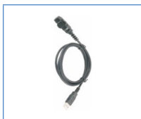
Кабель для программирования (USB-порт)